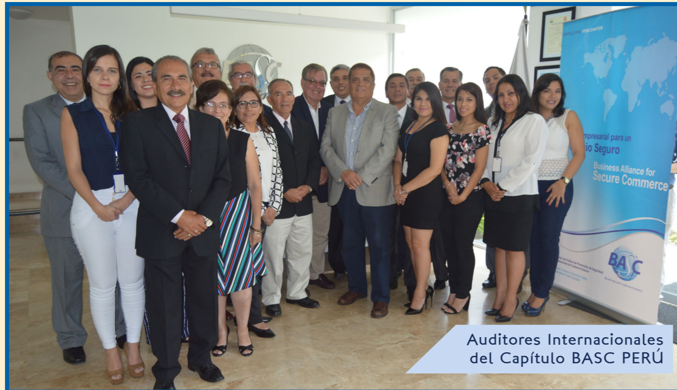
Audidores Internacionales del Capítulo BASC PERÚ

El área de operaciones del Capítulo BASC PERÚ en estos 20 años ha centrado su esfuerzo en brindar un eficiente servicio a sus asociados, a través de auditorías con generación de valor para fortalecer el Sistema de Gestión en Control y Seguridad BASC con el objeto de minimizar la materialización de riesgos, producto de las amenazas externas e internas, relacionadas a actividades ilícitas.